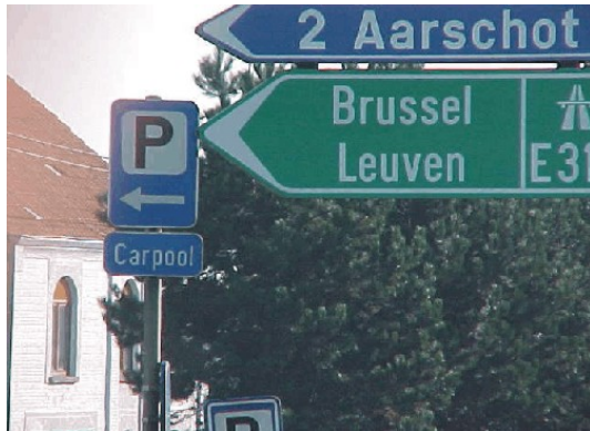
Signalisation en amont