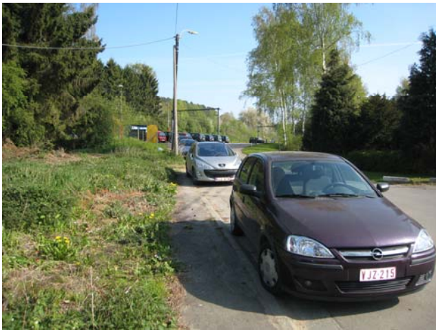
Accès au quai par le parking