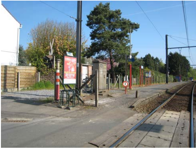
Accès au Quai – Direction Ottignies