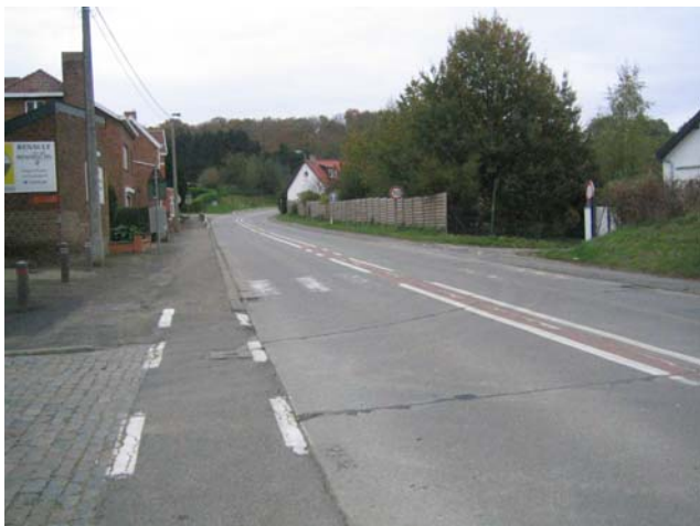
Accès gare - rue Basse