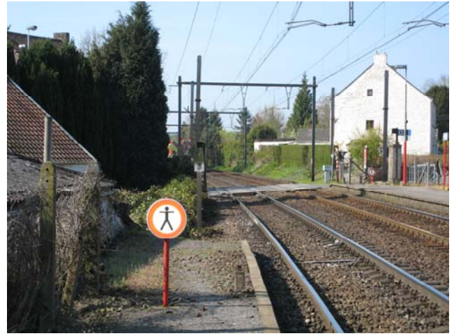
Accès au Quai – Direction Charleroi