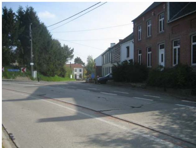
Accès gare - rue de Faux